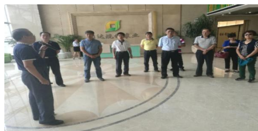
陵水润达现代农业科技发展有限公司