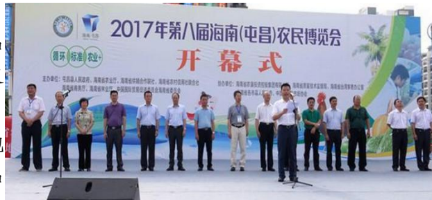
农博会开幕式现场

本届农博会展示展销的农产品丰富多样，省内各市县热带高效农产品、农业加工品，时令的荔枝、芒果、苦瓜等热带水果蔬菜及本地特色的禽畜产品，水产品、海产品得到顾客的青睐，省外农产品品种