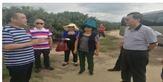
陵水鲁宏农业开发有限公司荔枝基地