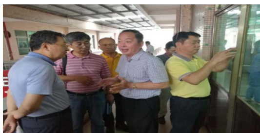
在文昌春光食品有限公司调研

陵水：规模化的农产品品牌主要有“陵水圣女果”、“美月西瓜”、“鲁宏荔枝”，农产品的深加工处于起步阶段，农产品加工企业不能确定土地的使用，养殖和捕捞占全省产值的10%，缺乏规模化的加工厂，土地集约化流转比较难，农民配合土地流转的意愿低，是限制当地品牌农业发展的重要原因。