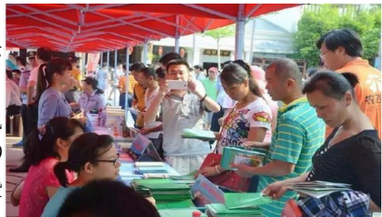
科技活动月开幕式现场

为深入实施创新驱动发展战略，展示琼海市各项科技成果，大力普及科学知识，提高全民科技素质，以科技服务琼海全域5A级景区建设。2017年5月11日上午9点，琼海市第十三届科技活动月开幕式暨科普大集活动在大路镇幸福街举行。