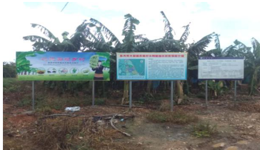
海南大学2017社会服务项目宣传图