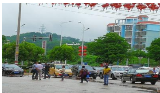
5月24日偶遇白沙电商园非洲考察团