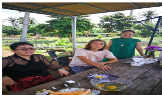
海南热带睡莲生产基地---南海莲华