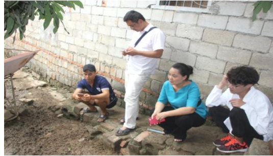
观察五脚猪的养殖环境

此次东方市的扶贫之行为期一天，一共调研和服务了三个村，虽然路途遥远，但此次的扶贫影响范围大，把技术带到了三个农村，把理论知识应用到实践中，提高了本科生的知识运用能力，解决了老百姓的问题，是一项非常有意义的民生工作。