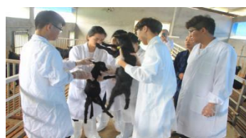
检查羊患有的结膜炎