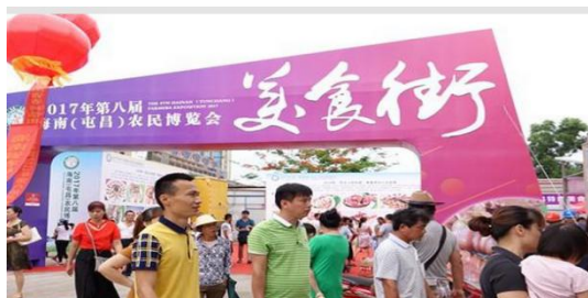
农博会开幕式现场