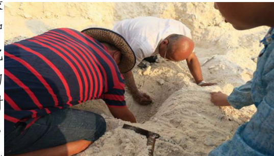
三沙市七连屿工委的海龟保护人员在转移海龟卵

据了解，西沙群岛是绿海龟主要产卵地之一，近年来，由于自然和人为原因，绿海龟的数量逐年减少。为更好的保护绿海龟，三沙市在七连屿北岛建设海龟保护工作站，在永乐群岛晋卿岛建立海龟孵化中心，并组织渔民在每年 4 月至 11 月的海龟产卵季，对各岛礁进行日常巡查，对海龟产卵点进行插牌、观察、转移、保护，记录海龟产卵孵化等信息，为下一步海龟保护的科研工作提供基础数据。