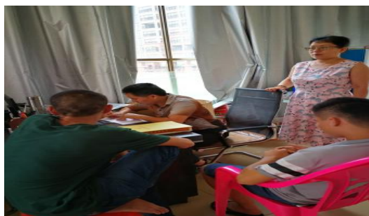
用收集的黎药给病人治病