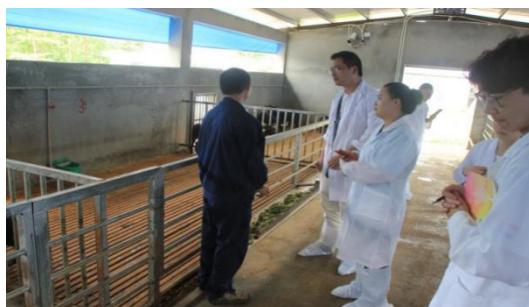
向厂长了解羊的养殖情况