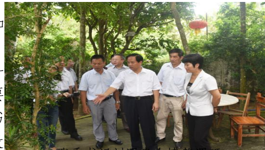
省委书记刘赐贵在博鳌调研

5月10日，省委书记刘赐贵率队深入博鳌地区调研并现场办公。刘赐贵对博鳌田园小镇的建设工作做了重要指示，强调要更加突显博鳌的田园风光和自然风貌，把博鳌建设成重要的休闲外交基地，更好地服务于我国的总体外交各工作和“一带一路”发展战略。