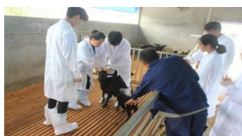
检查羊身上的虱子