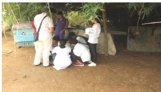
扶贫小组认真观察解剖鸡